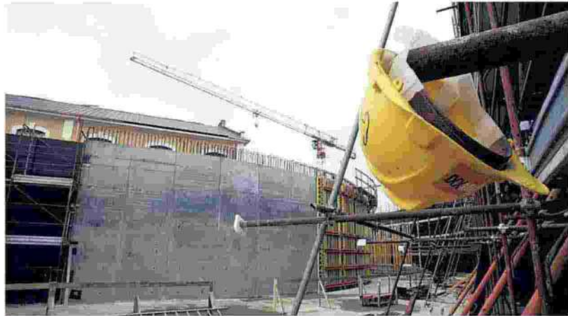
▲ Più lavoro La cassa edile ha registrato un 50 per cento in più