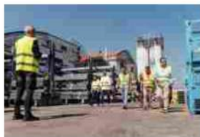
Kömmerling. Partnership con Comater per le nuove sfide di