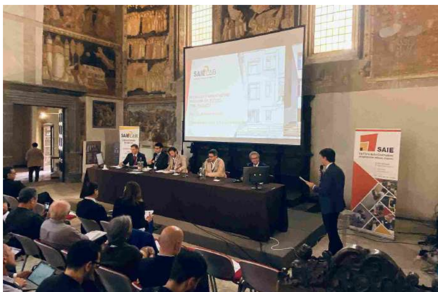
Saie Lab Napoli.

L'appuntamento – organizzato da Senaf in collaborazione con Federcostruzioni e con il patrocinio di Ance Campania, Acen, Cfs Napoli, Cifi, Oice, Ordine degli Architetti Pianificatori Paesaggisti e Conservatori di Napoli, Ordine degli Ingegneri di Napoli, UNI e l'Università degli Studi di Napoli Federico II – ha ospitato la presentazione di progetti di recupero che hanno portato a evidenti miglioramenti nella qualità della vita e nella sfera sociale, economica e ambientale del territorio. Inoltre, sono stati forniti spunti utili a imprese, progettisti, geometri, ingegneri e architetti per pianificare e realizzare interventi di rigenerazione urbana.