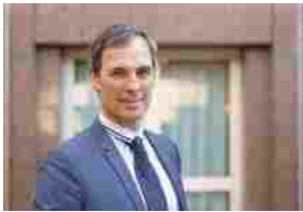
La filiera dell'idrogeno può essere la risposta alla decarbonizzazione