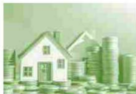
Acquistare casa nelle grandi città: 2023 vs 2021