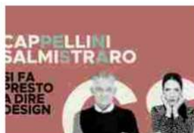
BigMat Quartarella. Si fa presto a dire design