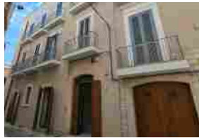
Il Demanio consegna all'Istat un immobile storico rigenerato