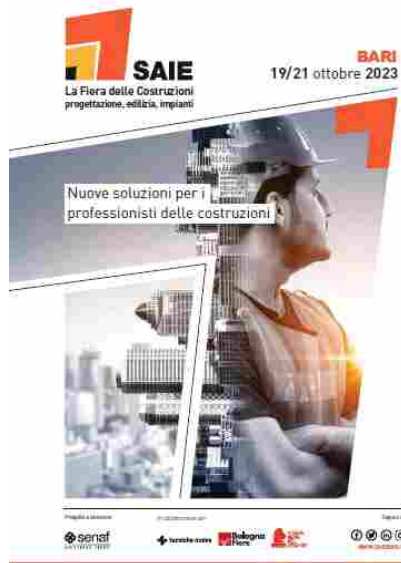
Saie | Fiera delle Costruzioni a Bari.

Le costruzioni sono un comparto fondamentale per l'economia della Campania. Alla fine del primo trimestre 2023 il settore conta più di 67.000 imprese attive, determinando il 13% di tutto il tessuto produttivo regionale. Se il numero di aziende è in lieve aumento rispetto allo stesso periodo del 2022 (+1%), nel confronto con i livelli pre-pandemia del 2019 si è registrato un vero e proprio boom (+10%) [Elaborazione Saie su fonte dati Movimprese].